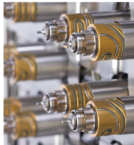
La technologie UltraSync permet de réduire l'espacement des buses.

Contactez Husky dès aujourd'hui pour plus d'informations sur la technologie de canal chaud UltraSync.